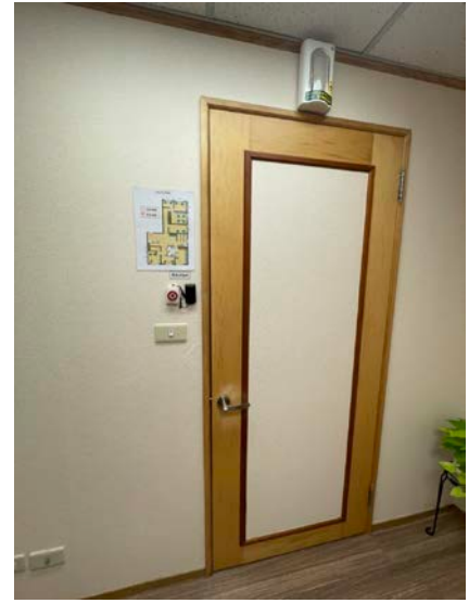
會談一：座位及安全設置