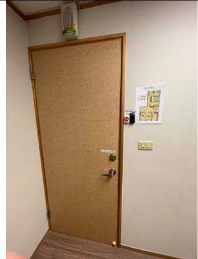
會談二：座位及安全設置