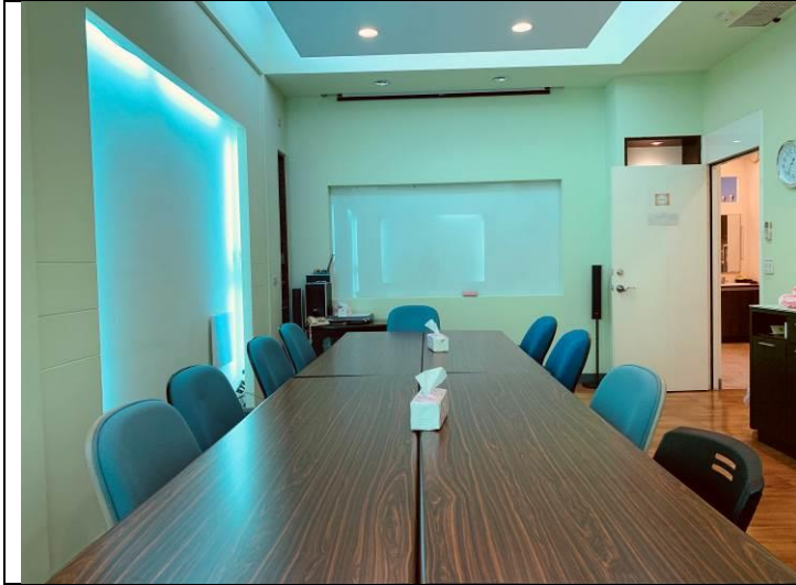
個案討論室暨會議室