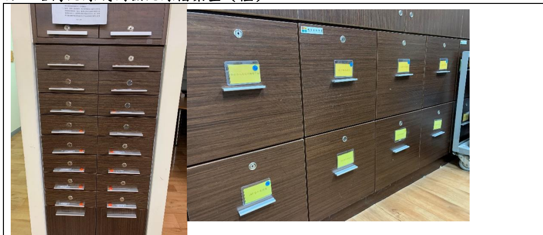
檔案櫃(本中心新紀錄已採線上系統方式執行)