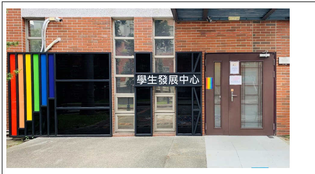
位於本校教學大樓 T1-106