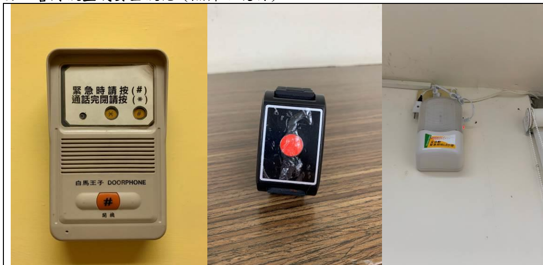
心理諮商室之警鈴、穿戴式警鈴、緊急照明設備