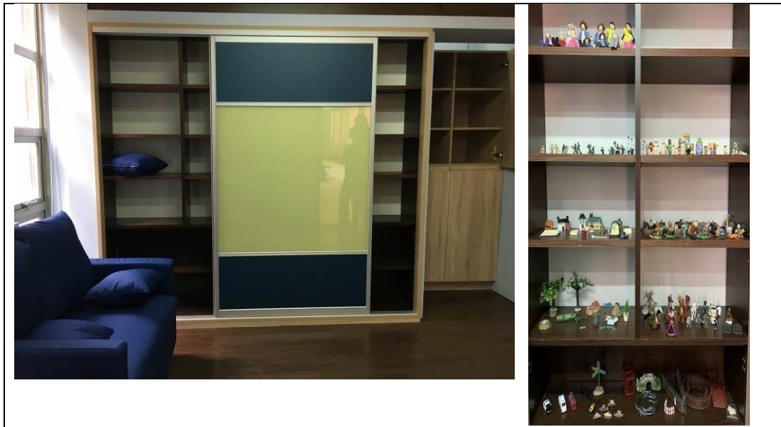
個別諮商暨抒壓室(附沙遊物件)