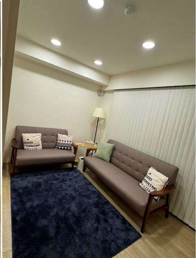
諮商室 B(個別/伴侶諮商)