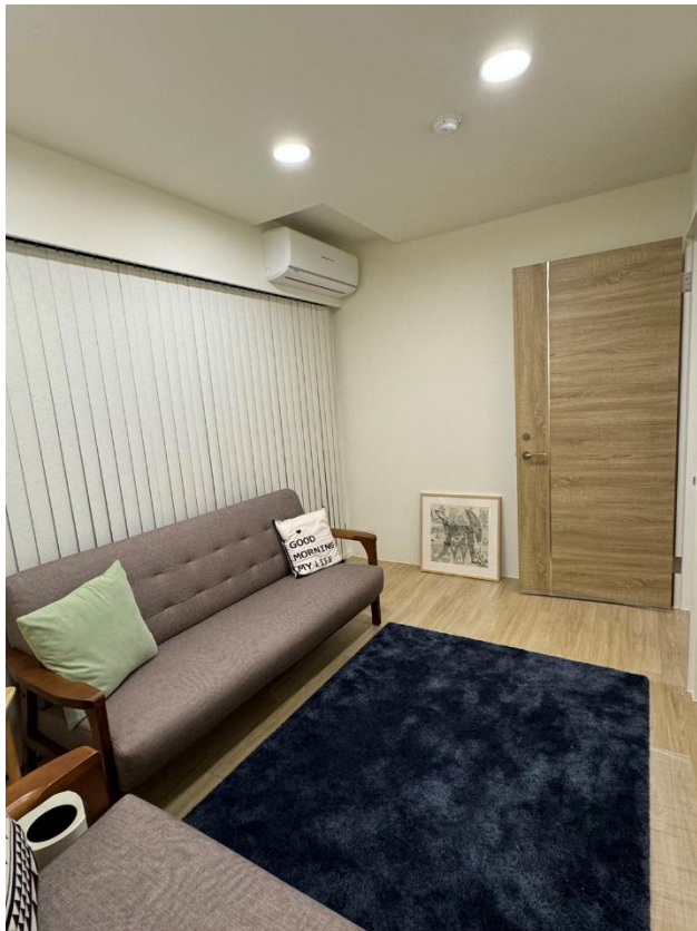
諮商室 A(個別/伴侶諮商)