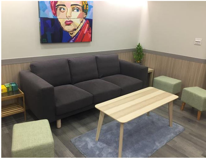
（多功能會議討論空間：學術討論、會議討論空間）