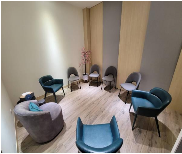
團體諮商或治療室內部