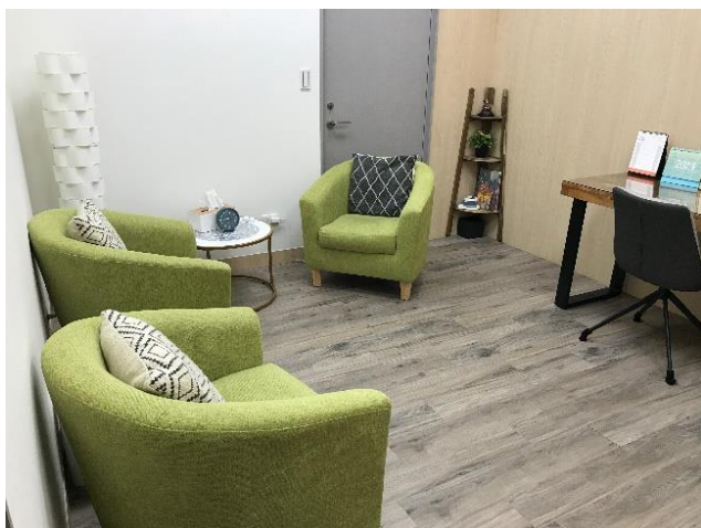
心理測驗/評估/衡鑑室內部