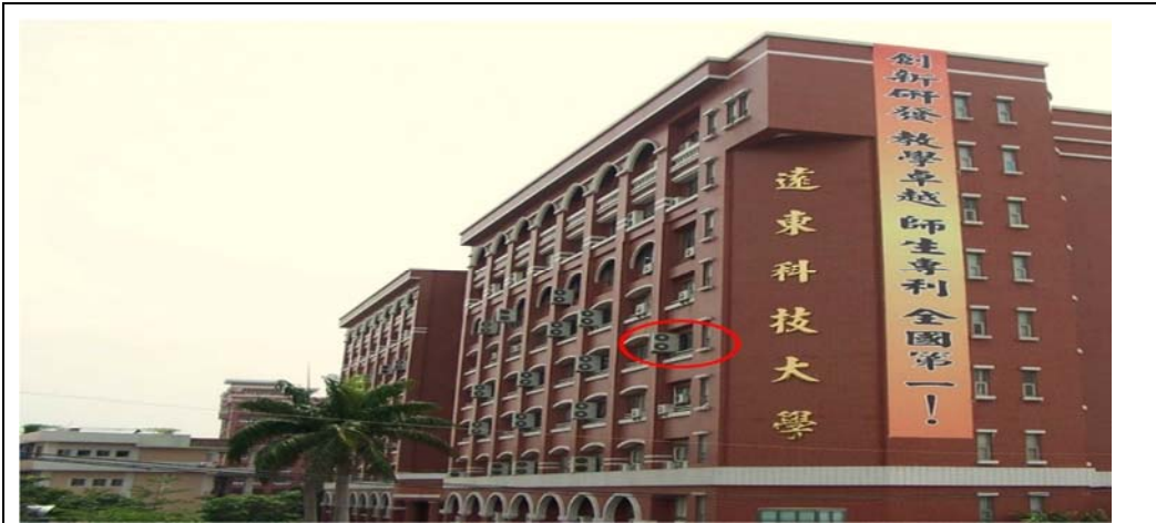
三德樓 4 樓