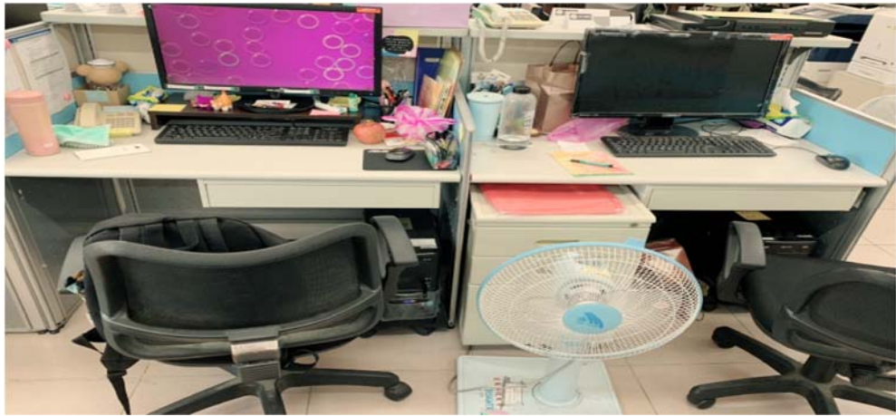
實習心理師辦公座位